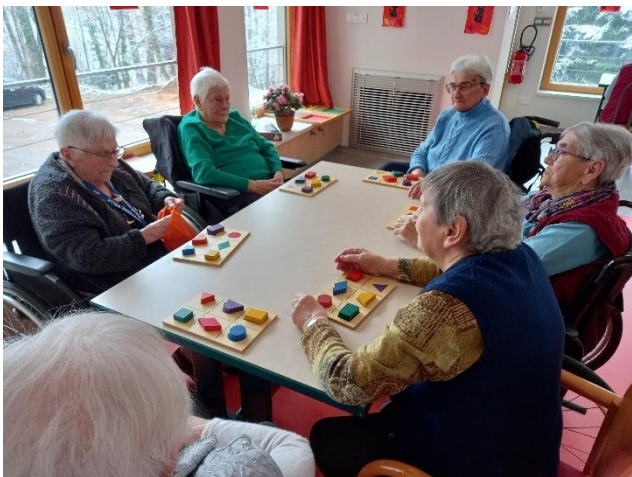
Jeux de société