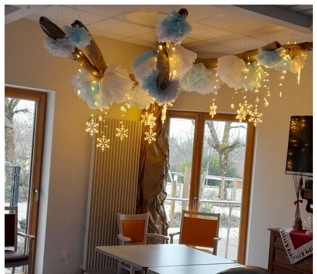
Décoration au PASA

Nous leur souhaitons la bienvenue parmi nous.