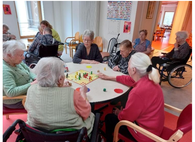
Jeux de société