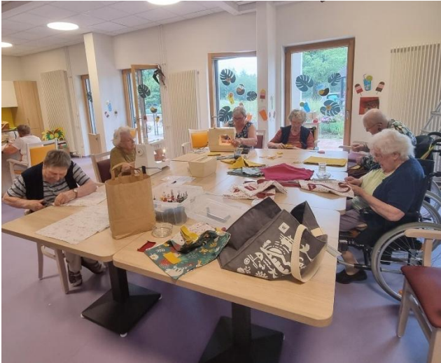
Atelier couture pour le marché de Noël