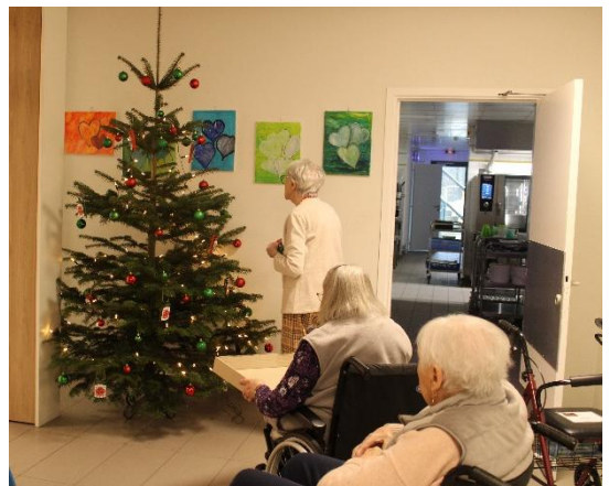
Décoration du sapin de l'entrée