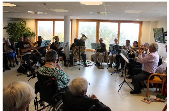
Culte avec la fanfare de Bust

Tout le monde est reparti avec un souvenir. Sur le chemin du retour, nous nous sommes arrêtés à la cafétéria du Super U à Diemeringen.