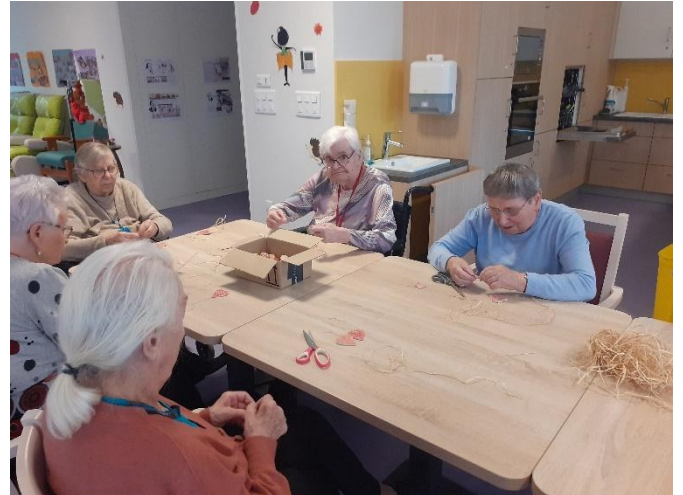
Préparation de cœurs en céramique