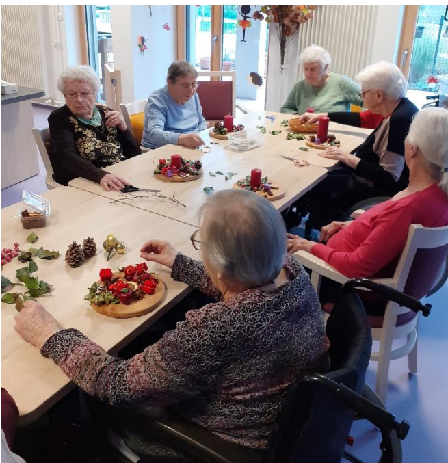
Bricolage de Noël au PASA