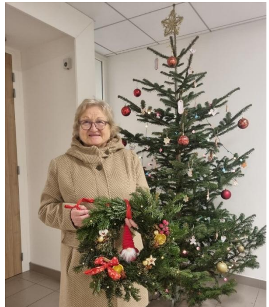
La gagnante de la tombola du marché de Noël