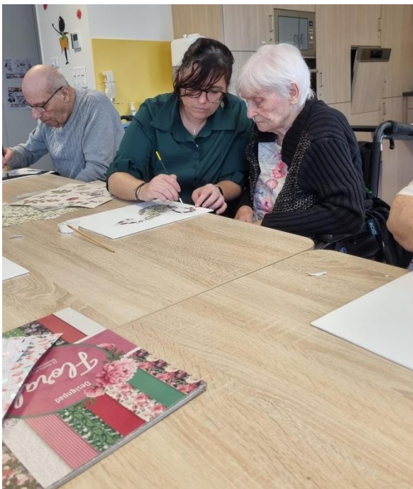
Animation avec l'art-thérapeute