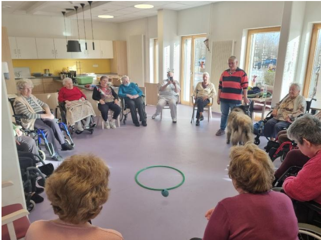
Médiation animale au PASA