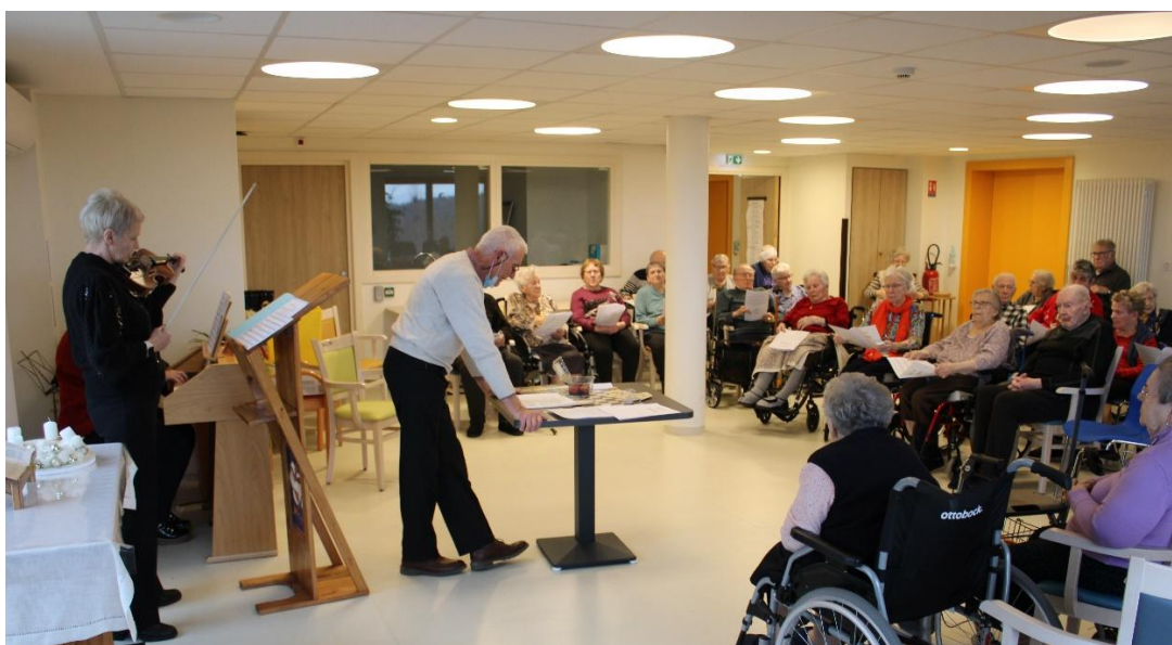
Veillée de Noël du 24 décembre