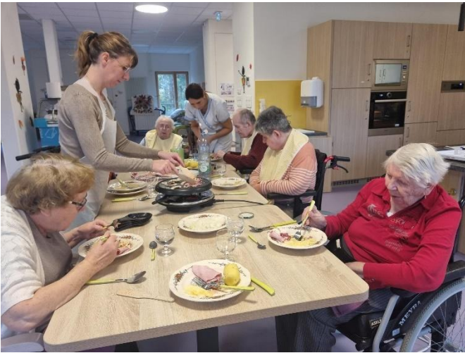
Raclette au PASA