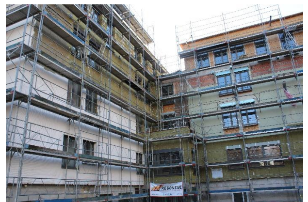
Travaux d'aménagements extérieurs avec la pose des réseaux et des pavés