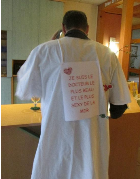
Le reconnaissez-vous ? Poisson d'avril !