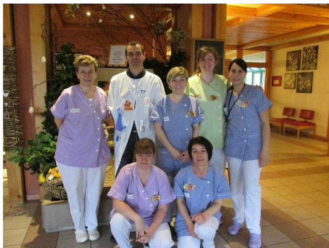
Avez-vous reconnu le docteur le plus beau et le plus sexy de la MDR ?