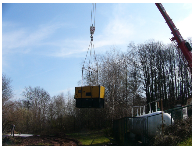
Mise en place du groupe électrogène