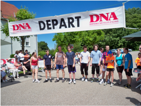
Le départ des 7 kms

Après le goûter, il y a eu la remise des prix sous les applaudissements. Le coureur qui s'est classé premier dans chaque catégorie a aussi permis à son parrain ou sa marraine de remporter un prix. Comme chaque année, les résidents ont eu la chance de recevoir de nouvelles chaussures (offertes par un sponsor très fidèle de la région).