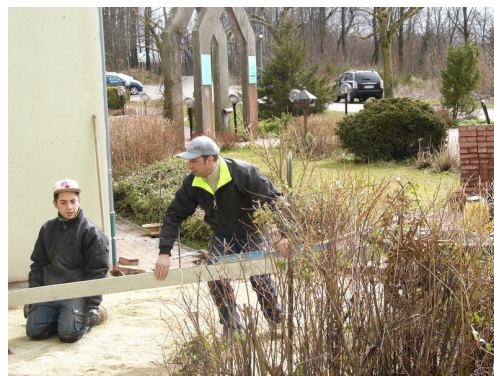
Les travaux devant la chapelle

Texte trouvé dans les DNA par Marthe SAND