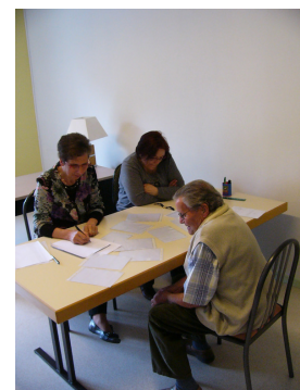
Le jeu de mémoire avec 2 jurys différents