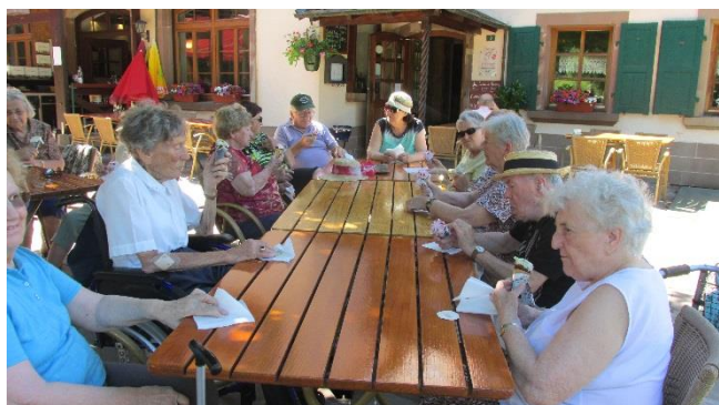
Sortie à Imsthal pour déguster une glace

Vous pouvez aussi retrouver le journal «Murmures» et d'autres informations sur notre site : www.kirchberg67.fr