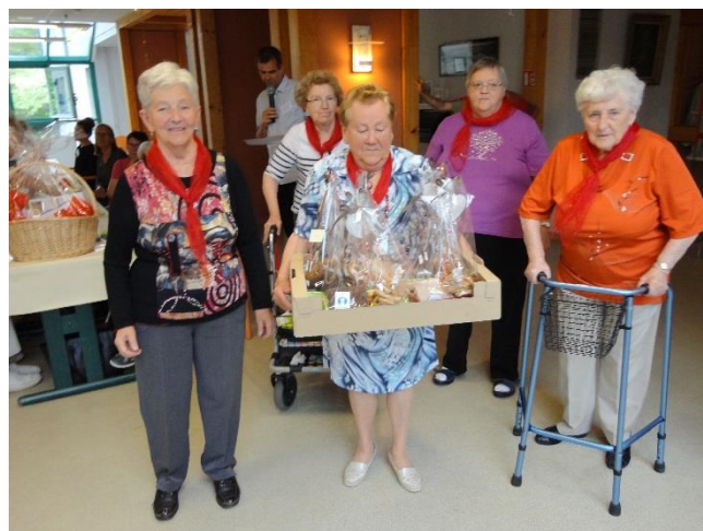
L'équipe des rouges lors du tournoi sportif