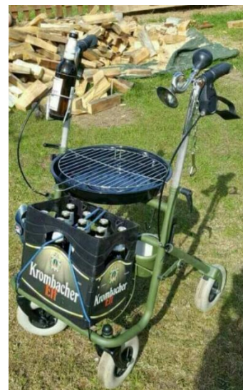
Rien ne se perd

Texte proposé par Anny ZIELINGER, fille de Louise LETSCHER