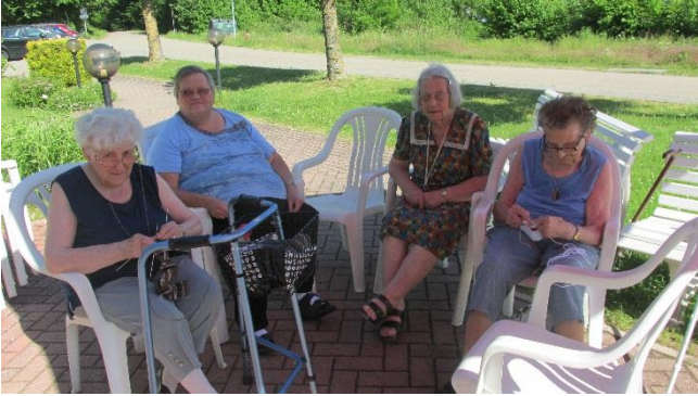
Devant la maison de retraite