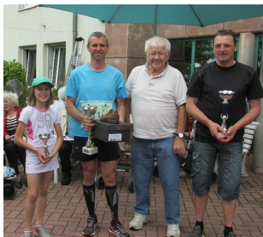
Les gagnants des 3 courses avec un des parrains

Tout au long de l'après-midi, des boissons fraîches et des gâteaux ont été servis aux résidents, aux familles et aux sportifs.