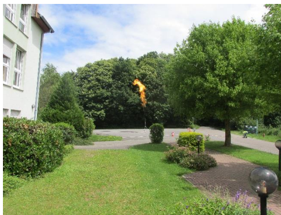
Travaux sur citerne de gaz